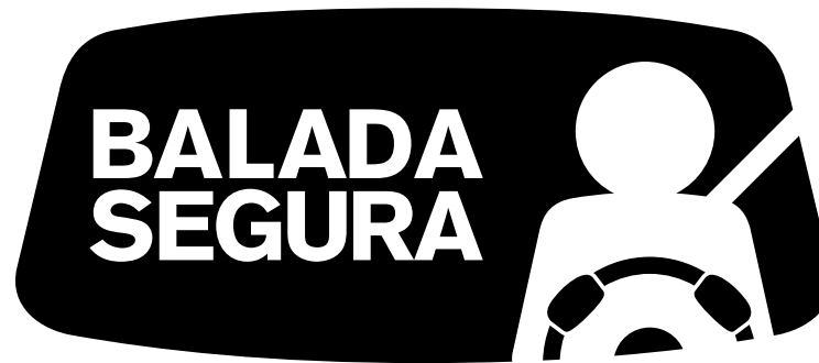
Versão Positiva Preferencial

Deve-se evitar o uso dessas versões em peças impressas que oferecem a possibilidade de uso da assinatura na versão colorida.